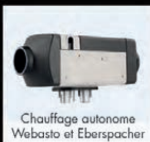
Chauffage autonome Webasto et Eberspacher