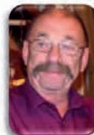
06 82 80 87 52 communication.ffaccc451@gmail.com