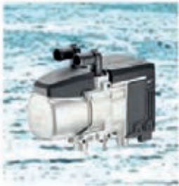
Chauffage à eau HYDRONIC