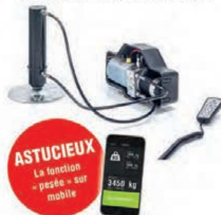
Vérins hydrauliques HY4 La stabilité où que vous soyez

ASTUCIEUX La fonction « pesée » sur mobile