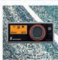
Commande EASYSTART PRO