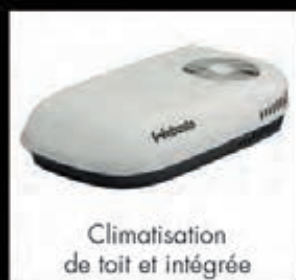
Climatisation de toit et intégrée