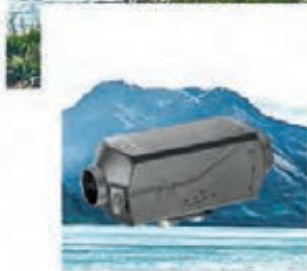
Chauffage à air AIRTRONIC