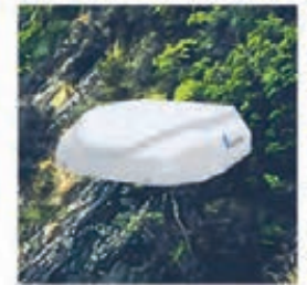
Rafraîchisseur d'air EBERCOOL