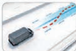
Nouveaux systèmes avancés d'aide à la conduite