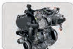
Nouveaux moteurs Euro 6D-Final

Ducato est le compagnon de confiance pour les voyageurs du monde entier depuis quarante ans : une véritable icône de liberté et de technologie. Aujourd'hui, Ducato est plus en avance et plus fiable que jamais. Découvrez les nouveaux moteurs Euro 6D-Final à faibles émissions et rendement amélioré : reposez-vous sur les nouveaux systèmes avancés d'aide à la conduite (ADAS), profitez du tout dernier système d'info-divertissement sur la nouvelle planche de bord et bénéficiez des toutes dernières fonctionnalités pour rendre votre expérience encore plus extraordinaire. Apprêtez-vous à vivre une histoire de bonheur sans fin, pour vous et toute votre famille.