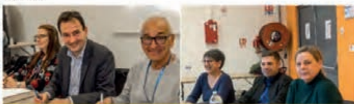
Signature de la convention

Dimanche, à l'occasion du Conseil d'Administration, la Fédération Française des Villages Etapes a présenté son label et finalisé la signature d'une convention de partenariat entre nos deux fédérations.