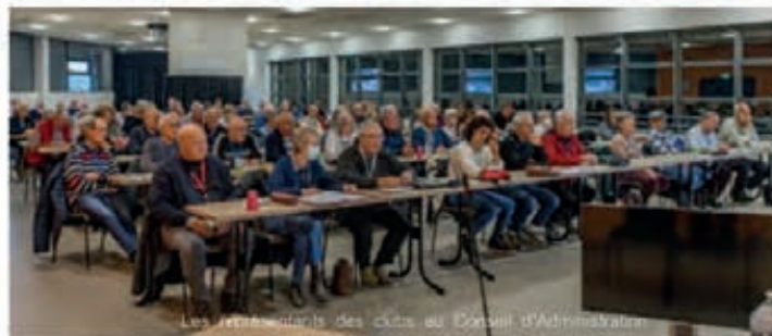
Les représentants des clubs au Conseil d'Administration

La journée de samedi a été consacrée aux réunions du Comité Exécutif de la FFACCC suivie par celle des présidents de clubs.