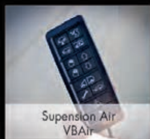
Suspension Air VBAir