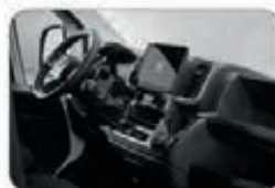
Nouveau tableau de bord et système d'info-divertissement