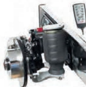
Suspensions pneumatiques AL-KO : confort et sécurité de 1 re classe