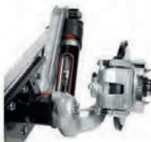
Suspension arrière ALC : position constante quelle que soit la charge