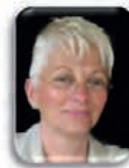
06 24 70 66 19 partenaires.ffaccc@gmail.com