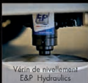
Vérin de nivellement E&P Hydraulics