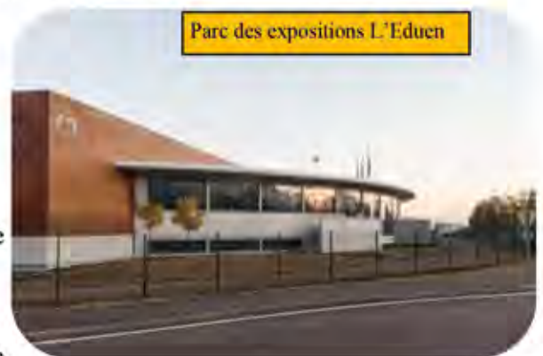
Parc des expositions L'Eduen