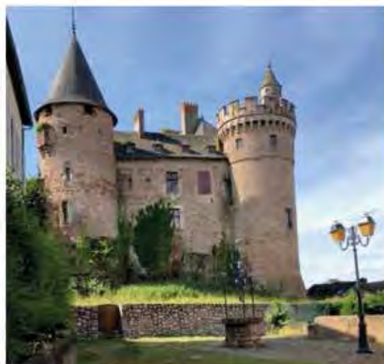
Une vue inhabituelle du Château