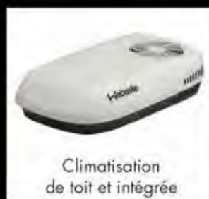
Climatisation de toit et intégrée