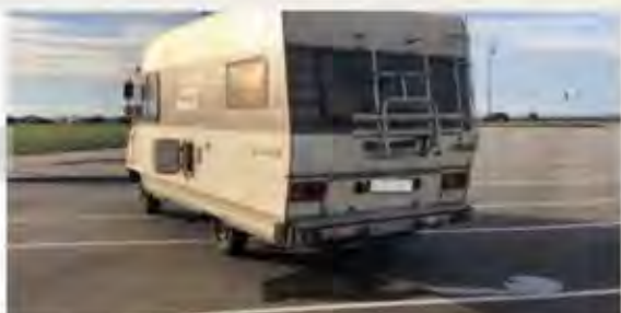
Une vidange volontaire ou même accidentelle, en dehors des lieux appropriés, dégrade l'image des camping-cars.