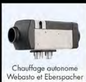
Chauffage autonome Webasto et Eberspacher