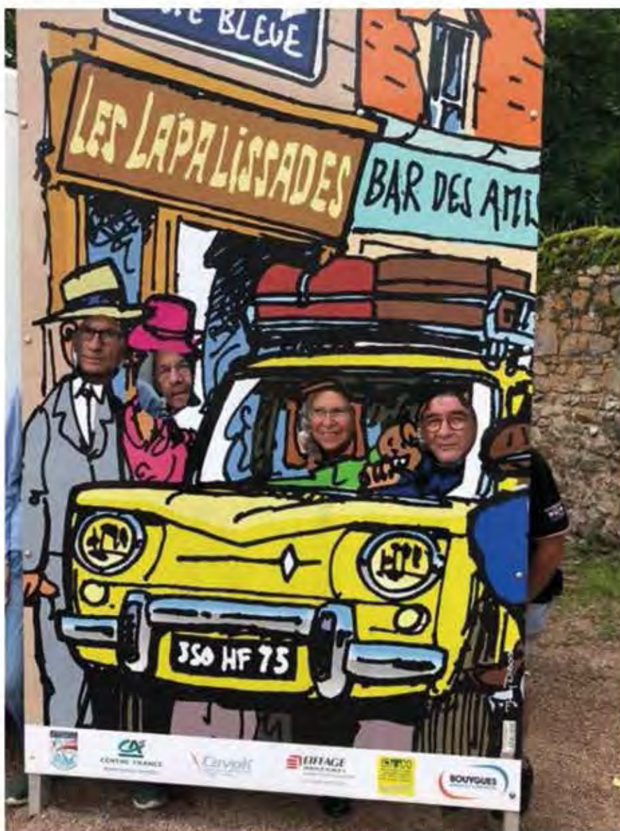
Le bureau s'amuse !!!