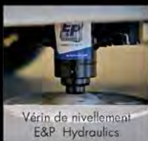
Vérin de nivellement E&P Hydraulics