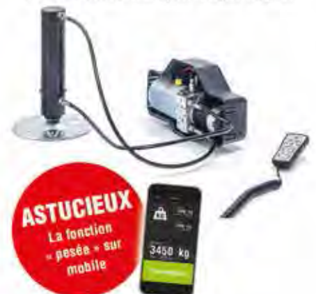
Vérins hydrauliques HY4 La stabilité où que vous soyez

ASTUCIEUX La fonction « pesée » sur mobile