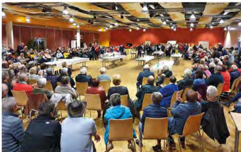
Le Forum des Voyages, un rendez-vous annuel lancé il y a 12 ans à l'initiative de la FFACCC et dont l'organisation est laissée chaque année à un club différent... et volontaire.

en toute convivialité à des tarifs préférentiels créés par les adhérents pour les adhérents; • de vous porter assistance lors de vos voyages à l'étranger (contact avec les ambassades comme ce fut le cas en 2020 pour des équipages bloqués en Grèce, Italie et Maroc); • de vous mettre en relation avec des agences de voyages spécialisées dans notre mode de loisir en les faisant participer au Forum des voyages organisé chaque année à l'automne; • de vous faire bénéficier de l'assistance et de la protection juridique pour tous les véhicules de votre foyer par l'intermédiaire d'un club affilié;