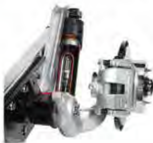
Suspension arrière ALC : position constante quelle que soit la charge