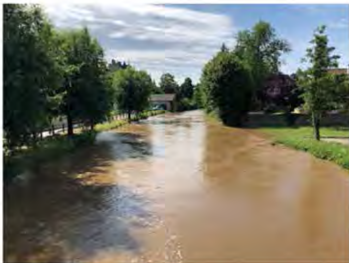
La Besbre peut connaître une crue