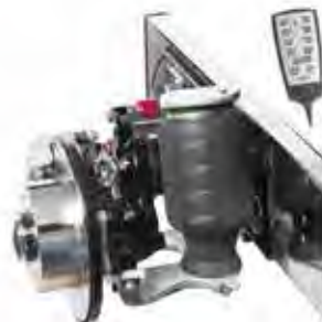
Suspensions pneumatiques AL-KO : confort et sécurité de 1 re classe