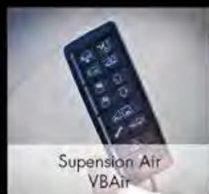
Suspension Air VBAir